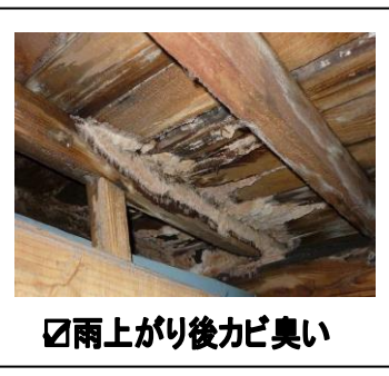
☑雨上がり後カビ臭い