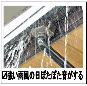
☑強い雨風の目ぼたぼた音がする