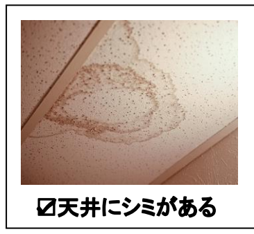
☑天井にシミがある