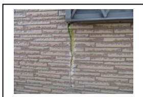
外壁材のひび割れ・劣化