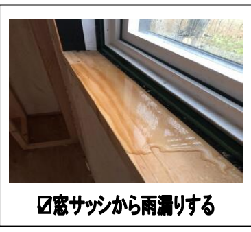
☑窓サッシから雨漏りする