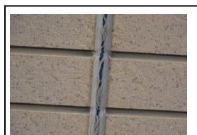
コーキングの劣化